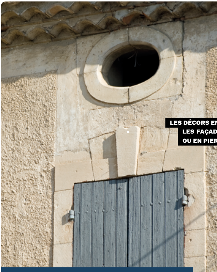
LES DÉCORS EN PIERRE ORNENT LES FAÇADES ENDUITES OU EN PIERRE DE TAILLE