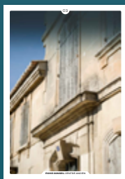
03 les façades en pierre de taille

Chaque intervention sur les façades de nos centres anciens compte et participe à l'harmonie du paysage urbain. Au cœur de nos villes et villages, l'intérêt particulier et l'intérêt général doivent être conjugués pour créer le cadre de vie que nous y recherchons tous.