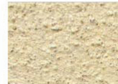
T jaune 1030-Y15R