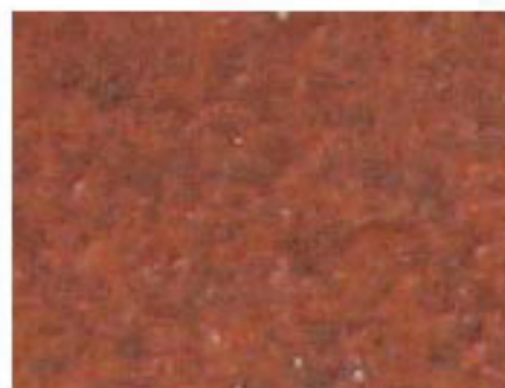
tuile rouge vieillie