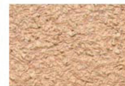
T ocre rose 2520-Y40R