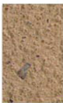
sables rose et jaune