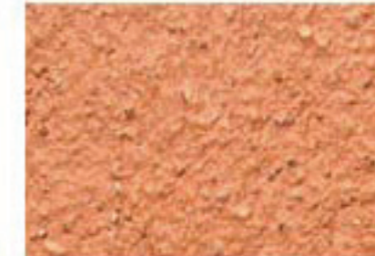
T rouge brique 2040-Y60R