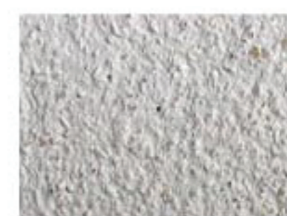
T beige clair 1005-Y20R