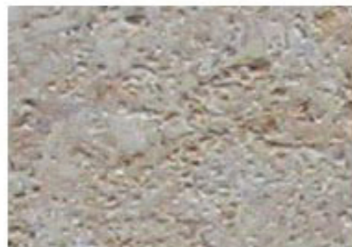
grès de Furne