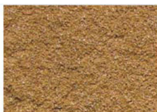
brique moulée paille