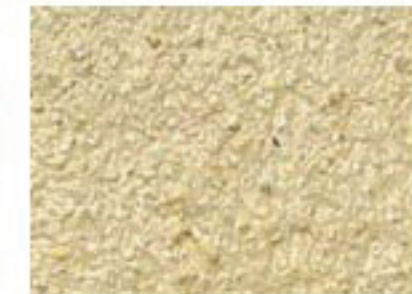
T paille 2030-Y10R