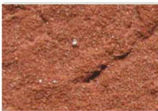
brique moulée rouge