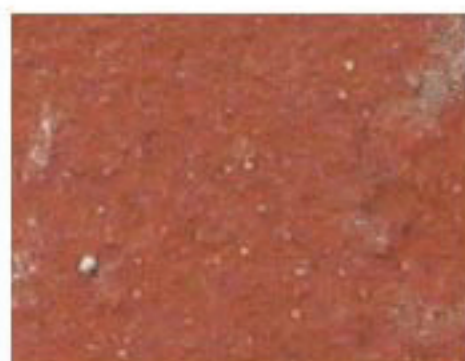
tuile ocre rouge