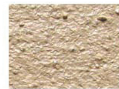
T terre 2020-Y25R