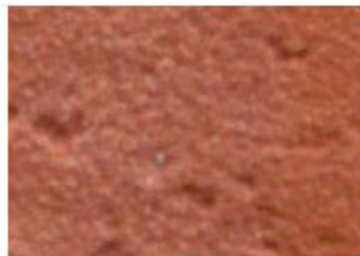
brique moulée rose