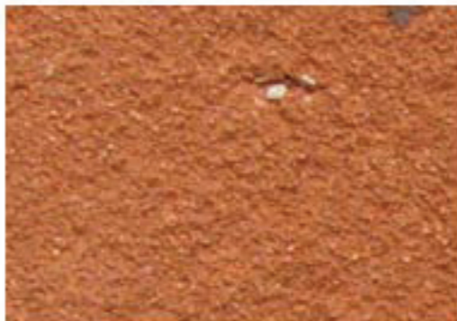
brique moulée orangée