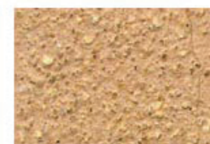
T ocre orangé 3030-Y30R