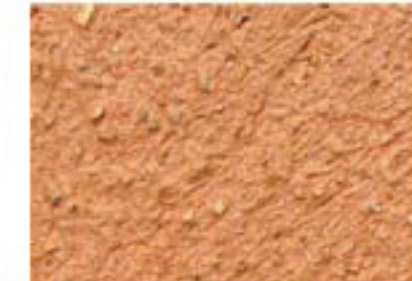
T rouge foncé 4030-Y50R

Ces teintes peuvent s'appliquer sur les façades d'immeubles à peindre. Les références proviennent du Natural Color System (N.C.S.).