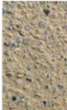
sables gris et jaune