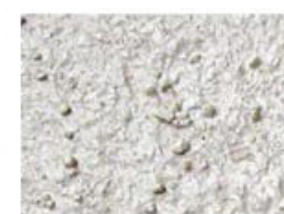
T grège 3010-Y20R