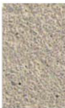
sable roux 2