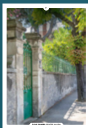
11 les clôtures

Chaque intervention sur les façades de nos centres anciens compte et participe à l'harmonie du paysage urbain. Au cœur de nos villes et villages, l'intérêt particulier et l'intérêt général doivent être conjugués pour créer le cadre de vie que nous y recherchons tous.